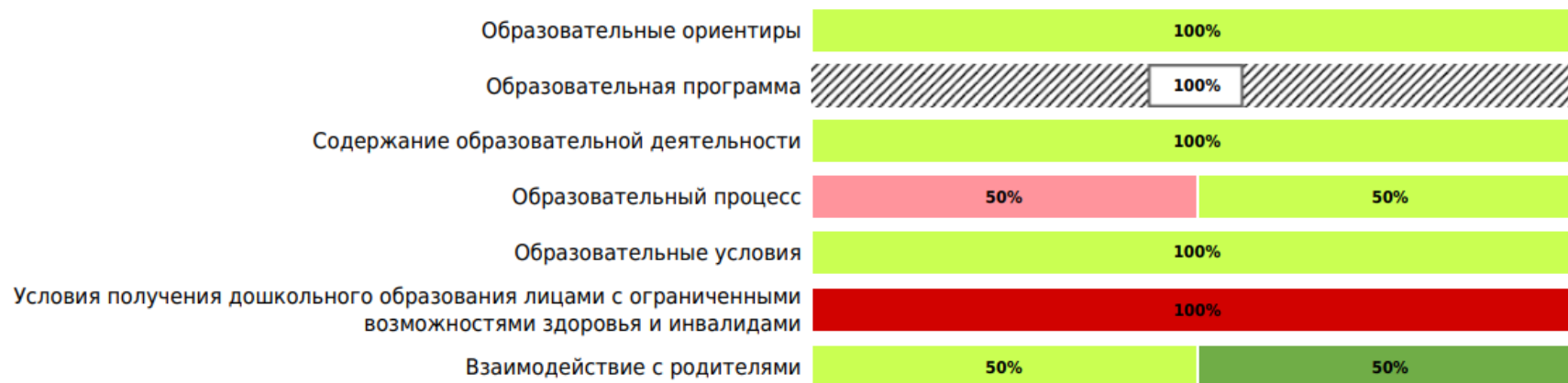
Доли ДОО с разными баллами у их ООП ДО ДОО (внешняя оценка)

В процессе внешней оценки было оценено 3 ООП ДО ДОО из 2 ДОО субъекта РФ.