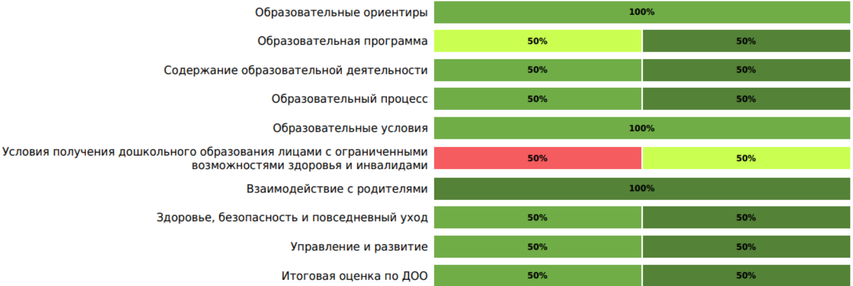
Доли ДОО с разными баллами (внутренняя оценка)

NP 0 баллов 1 балл 2 балла 3 балла 4 балла 5 баллов