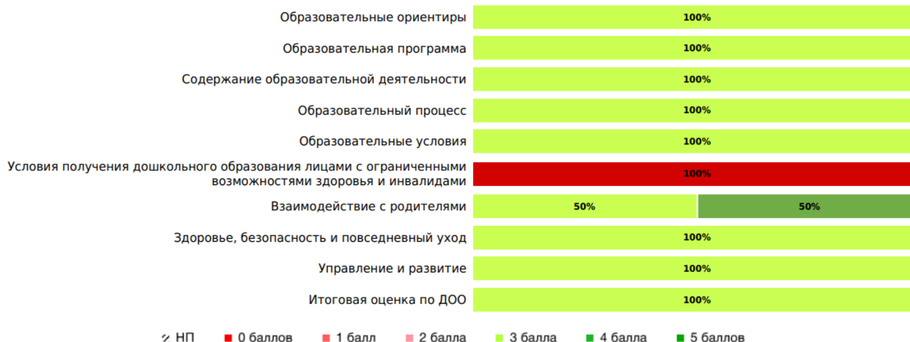
Доли ДОО с разными баллами (внешняя оценка)

В процессе внешней оценки по шкалам МКДО экспертами было оценено 3 групп(ы) ДОО из 2 ДОО субъекта РФ. Результаты внешней оценки качества образования в ДОО субъекта РФ по областям качества (по 5- балльной шкале):