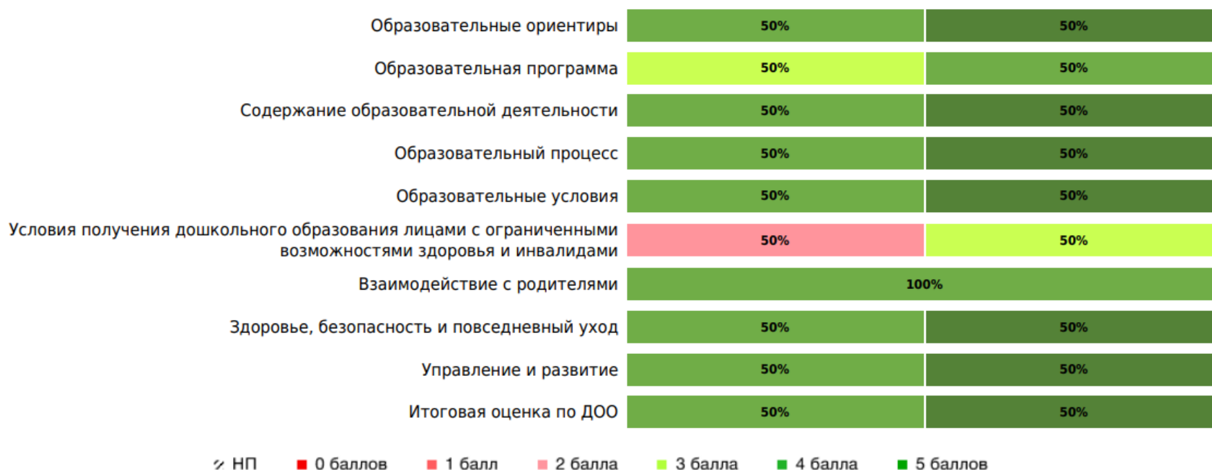
Доли ДОО с разными баллами у педагогов