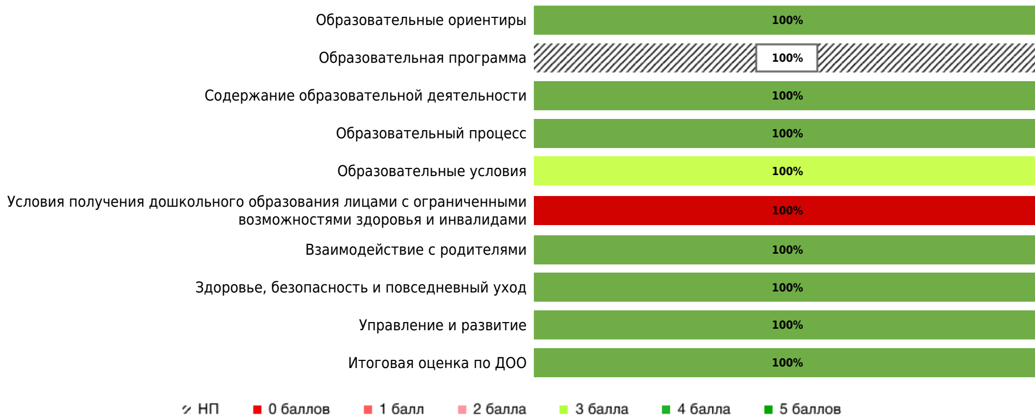
Доли ДОО с разными баллами у их ООП ДО ДОО (внешняя оценка)

В процессе внешней оценки было оценено 1 ООП ДО ДОО из 1 ДОО субъекта РФ.